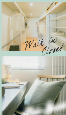
Walk in Closet