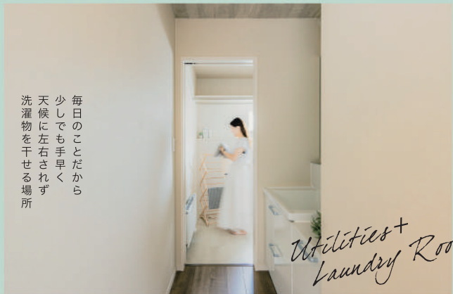
Utilities+ Laundry Room

セミダブルベッドを2つ並べてもゆとりのある空間。 ウォークインクローゼットは夫婦それぞれのスペースを確保。